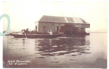
Letzte Rheinmühle bei Ginsheim.

Die beiden Møller im Groß-Rhein vor der Schiffsmühle 1909.